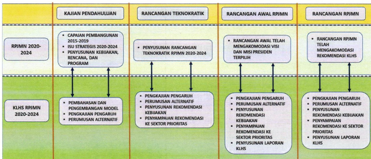
Gambar 3 Mekanisme dan Alur Pembuatan dan Pelaksanaan KLHS RPJMN TAHUN 2020-2024

MENTERI PERENCANAAN PEMBANGUNAN NASIONAL/ KEPALA BADAN PERENCANAAN PEMBANGUNAN NASIONAL,